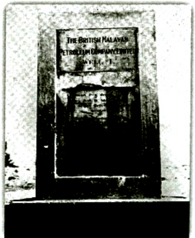
Dipetik dari buku Menjangkau Enampuluh Tahun - Sixty Years On 1929-1989 .

Minyak mula diterokai di Brunei Darussalam pada awal KM XX dengan penggerudian telaga minyak yang pertama pada tahun 1899 di kawasan Ayer Berkunchi berdekatan Bandar Seri Begawan. Menurut catatan, kedalaman telaga tersebut mencapai 259 meter namun tiada minyak ditemui. Bermula dari itu, beberapa buah telaga minyak