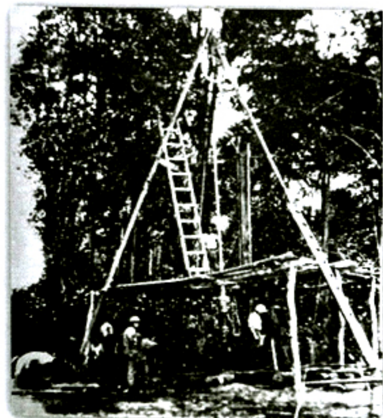
Dipetik dari buku The Discovery and Development of the Seria Oilfield .

Pada tahun 1915, British Borneo Petroleum Syndicate telah membuat satu perjanjian dengan Nederlandsche Koloniale Petroleum Maatschappij untuk mengusahakan carigali minyak di Rampayoh, Belait. Tiga tahun selepas itu, British Borneo Petroleum Syndicate menyerahkan konsesi yang diperolehinya kepada syarikat carigali yang lain pula, iaitu D'Arcy Exploration Syndicate namun minyak masih juga gagal ditemui.